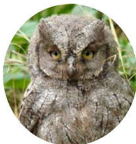
Jeune hibou Petit-Duc

Sortie du nid: De Juin à fin Juillet Yeux jaunes, plumes donnant l'illusion de sourcils. Tient dans une main.