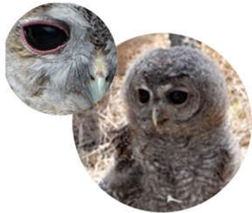
Jeune chouette Hulotte

Sortie du nid: De Février à Juillet Yeux noirs avec un contour rose, duvet gris/brun strié de brun plus foncé.