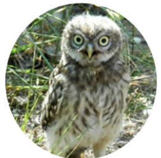
Jeune Chevêche d'Athéna

Sortie du nid: De Mars à Mai Yeux jaunes-orangés, duvet gris/brun, aigrettes sur la tête. Environ 30cm de haut.