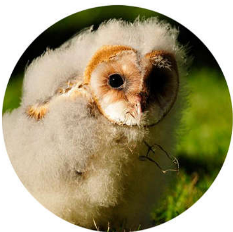
Jeune Effraie des clochers

Sortie du nid: De fin Juin à fin Août Yeux noirs, duvet blanc, disque facial brun en forme de cœur.