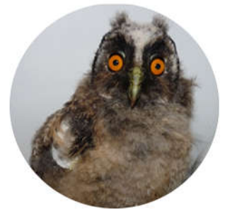
Jeune hibou Moyen-Duc

Au cours de cette phase d'émancipation indispensable à leur développement, ils apprendront à voler puis à chasser, accompagnés de leurs parents.