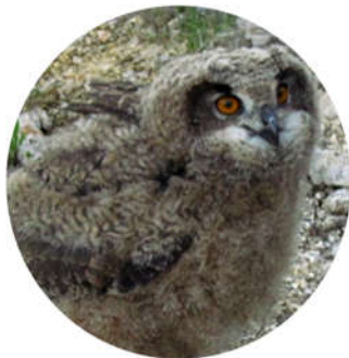
Jeune Grand-Duc d'Europe

Sortie du nid: De Février à Juillet Yeux noirs avec un contour rose, duvet gris/brun strié de brun plus foncé.